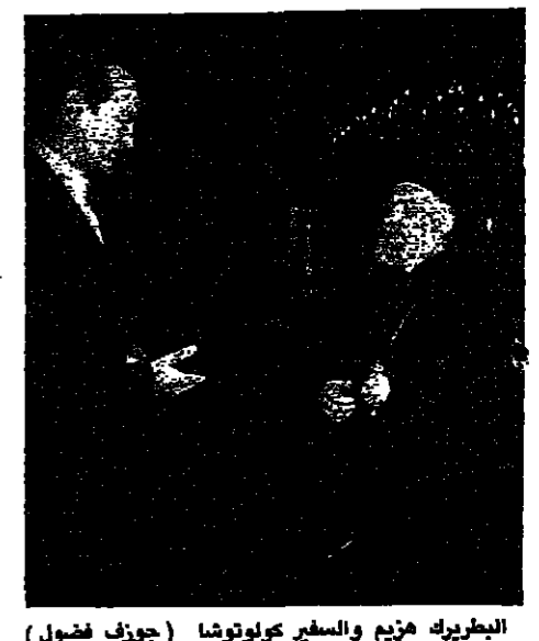
الطيار هزيم والسفير كحولوشا (جوزيف فضول)

لجنة السامعي الحميدة العربية، المنبثقة عن الجامعة العربية، تبدأ أعمالها غدا، لكنها تلتزم اليوم في العاصمة التونسية، لتحديد منح عملها، والذي يتوجه بشكل خاص، نحو حوار لبناني-لبناني، تحت مظلة عربية شاملة، ودعم دولي خصوصا من الدول الخمس الكبرى، وإن العضوية الدائمة في مجلس الأمن الدولي، من أجل إبعاد شبح التقسيم عن لبنان. وقد وصل رئيس اللجنة، نائب رئيس الوزراء وزير الخارجية الكويتي بعد ظهر أمس إلى تونس، وشرع باتصالاته مع أعضاء اللجنة الذين تواجدوا وصلوهم إلى العاصمة التونسية. وفي تصريح أدلى به قبل مغادرتهم الكويت شدد الشيخ الصباح على أن حل الأزمة اللبنانية منوط حتما بولاق اللبنانيين، وبالتنسيق بينهم وبين الدول العربية، وقال: نأمل في أن يكون أشقائنا اللبنانيون واعين، بأن مواصلة الاقتتال بين الأخوة، يمسره أو وحدة بلادهم وأمن واستقرار العالم العربي بأسره. وأضاف: إن نجاح اللجنة أو إخفاقها يعتمد على اللبنانيين أنفسهم. أضاف وزير الخارجية الكويتي إن اللجنة العربية